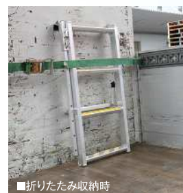
■折りたたみ収納時